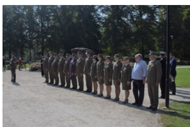
Przywitanie prochów gen. bryg. Jana Kazimierza Kruszewskiego w Zgorzelcu