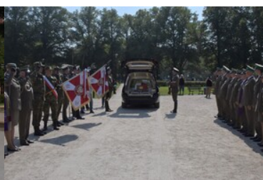
Przywitanie prochów gen. bryg. Jana Kazimierza Kruszewskiego w Zgorzelcu