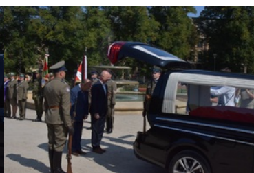
Przywitanie prochów gen. bryg. Jana Kazimierza Kruszewskiego w Zgorzelcu