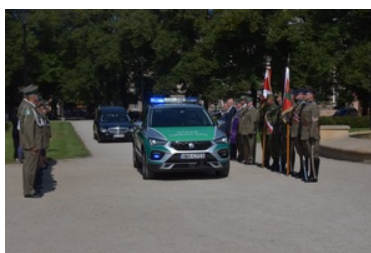
Przywitanie prochów gen. bryg. Jana Kazimierza Kruszewskiego w Zgorzelcu