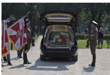
Przywitanie prochów gen. bryg. Jana Kazimierza Kruszewskiego w Zgorzelcu