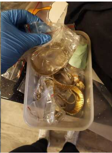
Wspolpraca sluzb 5