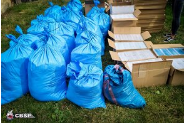
Wspolpraca sluzb 1