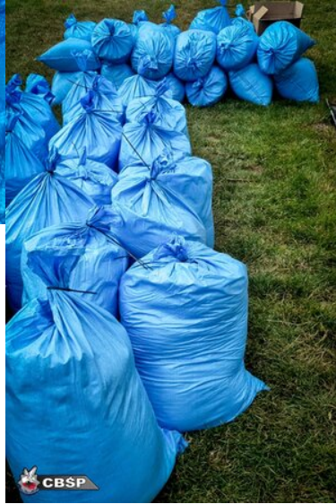
Wspolpraca sluzb 3