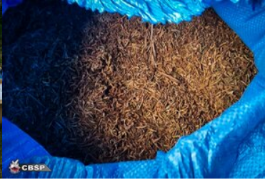
Wspolpraca sluzb 2