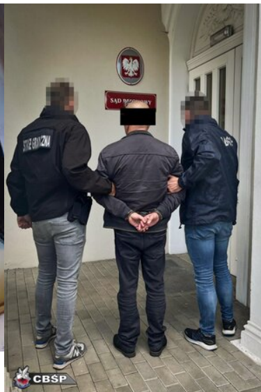
Wspolpraca sluzb 9