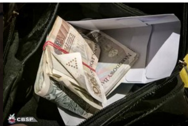
Wspolpraca sluzb 6