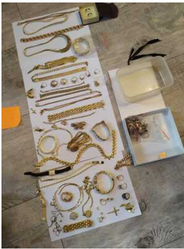
Wspolpraca sluzb 4