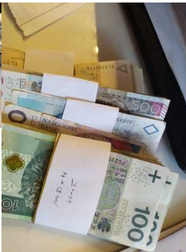
Wspolpraca sluzb 8