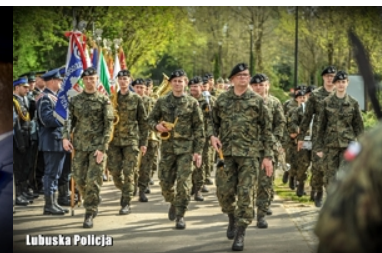
Uroczystości Dnia Pamięci Ofiar Zbrodni Katyńskiej w Gorzowie Wielkopolskim