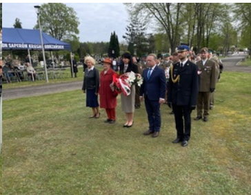
Uroczystości Dnia Pamięci Ofiar Zbrodni Katyńskiej w Krośnie Odrzańskim