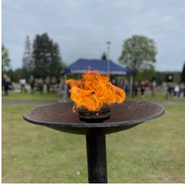
Uroczystości Dnia Pamięci Ofiar Zbrodni Katyńskiej w Krośnie Odrzańskim