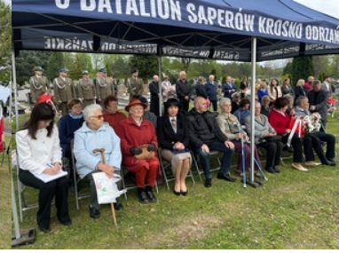
Uroczystości Dnia Pamięci Ofiar Zbrodni Katyńskiej w Krośnie Odrzańskim