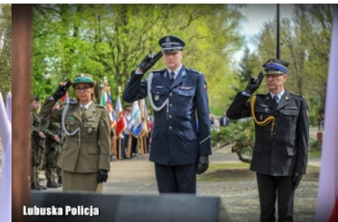
Uroczystości Dnia Pamięci Ofiar Zbrodni Katyńskiej w Gorzowie Wielkopolskim