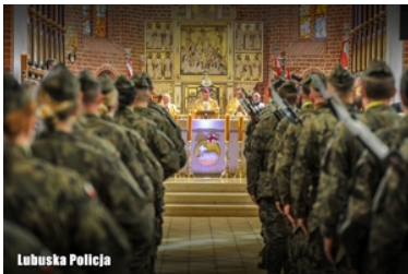
Uroczystości Dnia Pamięci Ofiar Zbrodni Katyńskiej w Gorzowie Wielkopolskim