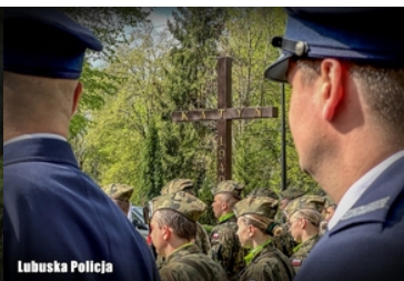
Uroczystości Dnia Pamięci Ofiar Zbrodni Katyńskiej w Gorzowie Wielkopolskim