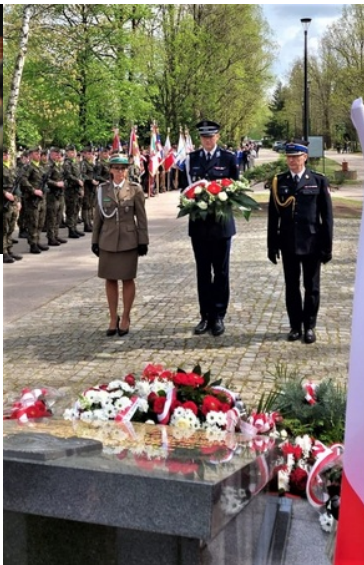
Uroczystości Dnia Pamięci Ofiar Zbrodni Katyńskiej w Gorzowie Wielkopolskim