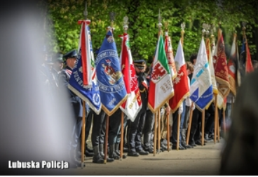
Uroczystości Dnia Pamięci Ofiar Zbrodni Katyńskiej w Gorzowie Wielkopolskim