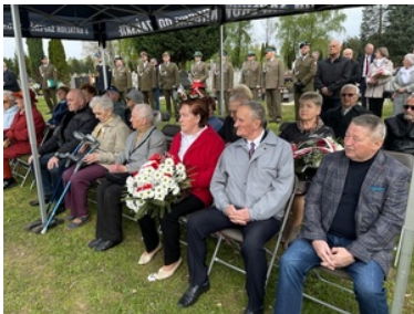
Uroczystości Dnia Pamięci Ofiar Zbrodni Katyńskiej w Krośnie Odrzańskim