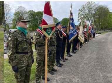
Uroczystości Dnia Pamięci Ofiar Zbrodni Katyńskiej w Krośnie Odrzańskim