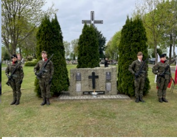
Uroczystości Dnia Pamięci Ofiar Zbrodni Katyńskiej w Krośnie Odrzańskim