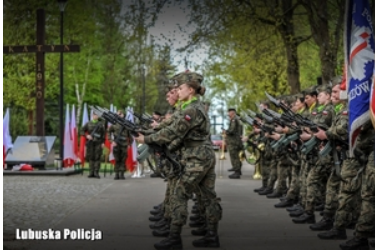
Uroczystości Dnia Pamięci Ofiar Zbrodni Katyńskiej w Gorzowie Wielkopolskim