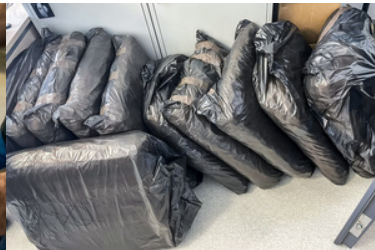
Akcja przejęcia narkotyków