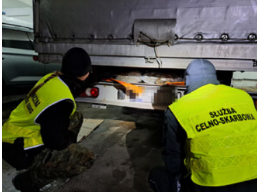
Akcja przejęcia narkotyków