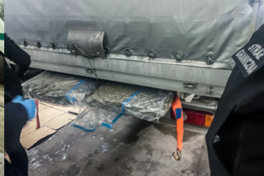
Akcja przejęcia narkotyków