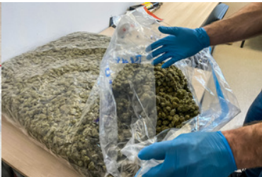
Akcja przejęcia narkotyków