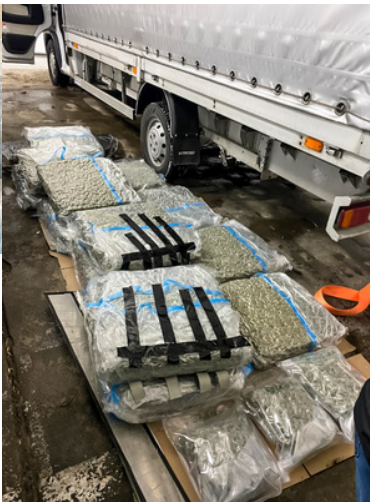
Akcja przejęcia narkotyków