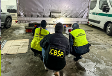
Akcja przejęcia narkotyków