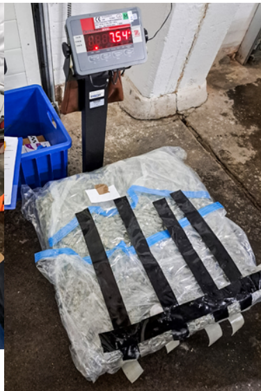
Akcja przejęcia narkotyków