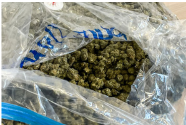
Akcja przejęcia narkotyków