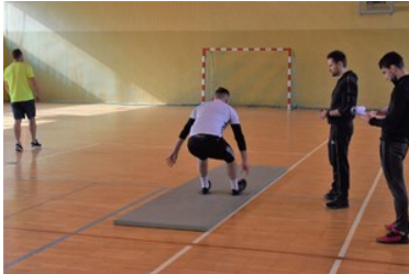
II etap postępowania kwalifikacyjnego