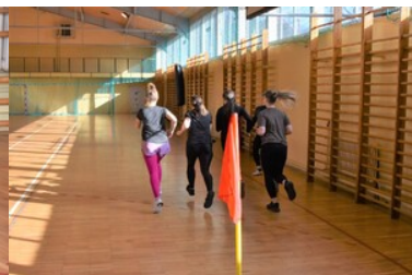
II etap postępowania kwalifikacyjnego