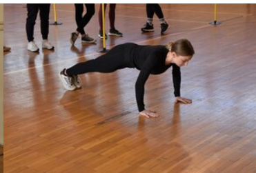
II etap postępowania kwalifikacyjnego