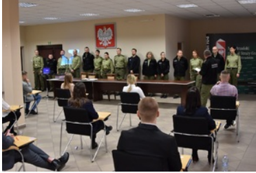
II etap postępowania kwalifikacyjnego