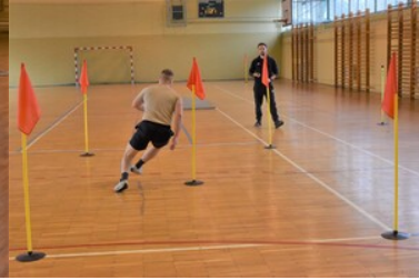
II etap postępowania kwalifikacyjnego