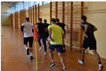
II etap postępowania kwalifikacyjnego