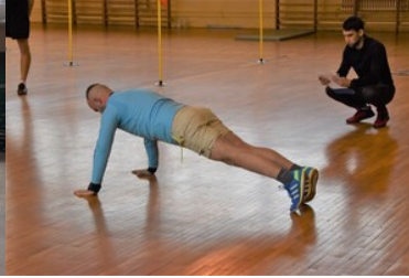
II etap postępowania kwalifikacyjnego