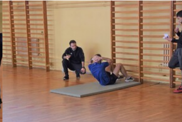
II etap postępowania kwalifikacyjnego