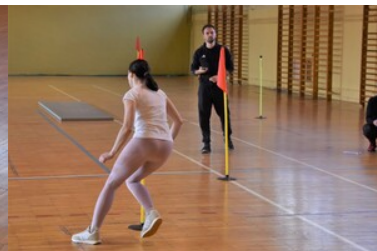
II etap postępowania kwalifikacyjnego