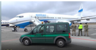
Funkcjonariusze SG na lotnisku