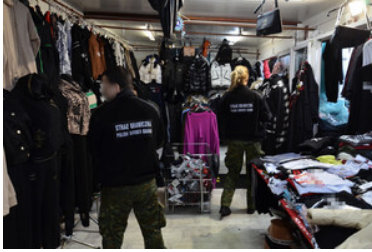
Zatrzymanie nielegalnego towaru