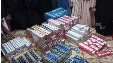
Zatrzymanie nielegalnego towaru