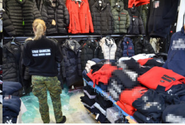
Zatrzymanie nielegalnego towaru