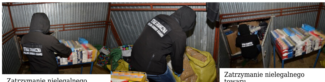
Zatrzymanie nielegalnego towaru

Za posiadanie wyrobów akcyzowych bez znaków akcyzy skarbowej oraz wprowadzanie do obrotu towarów z podrobionymi znakami towarowymi grozi zatrzymanemu kara grzywny, ograniczenia wolności albo pozbawienia wolności do 5 lat.