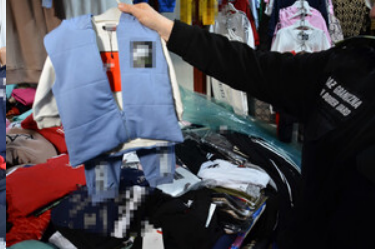
Zatrzymanie nielegalnego towaru