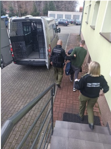
Zatrzymani poszukiwani Polacy