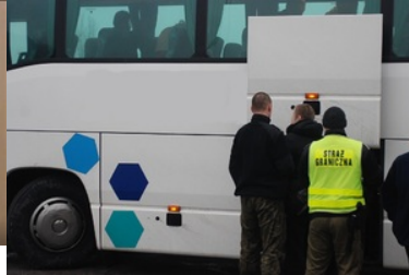
Zatrzymani poszukiwani Polacy