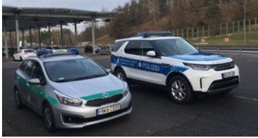
Wspólny polsko-niemiecki patrol funkcjonariuszy SG