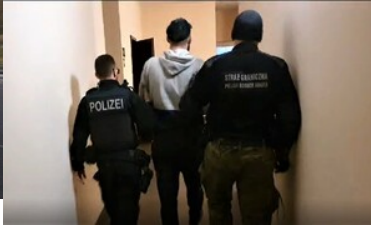
Zatrzymani poszukiwani Polacy