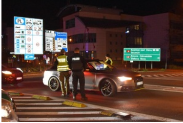
Wspólny polsko-niemiecki patrol funkcjonariuszy SG