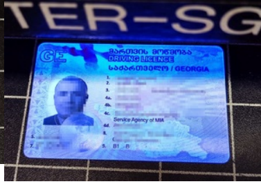
Zatrzymane gruzińskie prawo jazdy