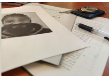
Kontrola legalności zatrudnienia