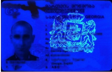
Zatrzymany podrobiony dokument cudzoziemca