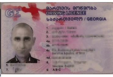
Zatrzymany podrobiony dokument cudzoziemca