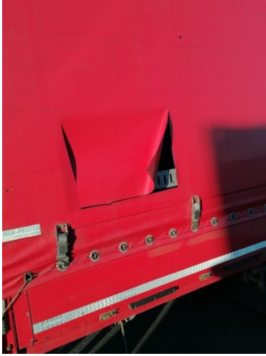
Kontrolowany samochód ciężarowy