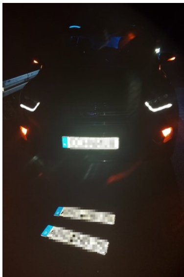
Odzyskano skradzionego forda o wartości 80 tysięcy złotych