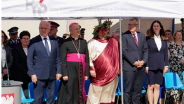
Wojewódzkie obchody dnia Krajowej Administracji Skarbowej