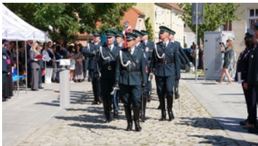
Wojewódzkie obchody dnia Krajowej Administracji Skarbowej