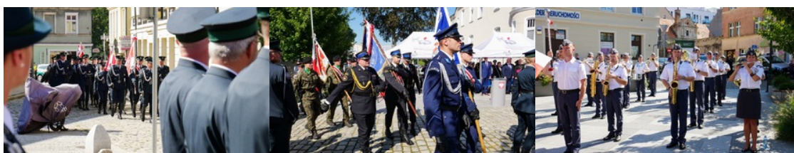
Wojewódzkie obchody dnia Krajowej Administracji Skarbowej