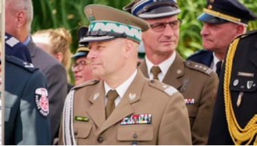
Wojewódzkie obchody dnia Krajowej Administracji Skarbowej