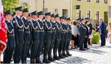
Wojewódzkie obchody dnia Krajowej Administracji Skarbowej