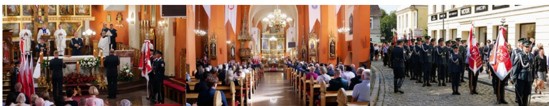
Wojewódzkie obchody dnia Krajowej Administracji Skarbowej

Funkcjonariusze Służby Celno-Skarbowej na co dzień zwalczają nielegalny hazard, zorganizowane grupy przestępcze zajmujące się przemytem towarów akcyzowych i wyłudzeniem podatku VAT. Przeciwdziałają praniu brudnych pieniędzy, kontrolują ruch i transport drogowy oraz współpracują z różnymi służbami, w tym oczywiście ze Strażą Graniczną.