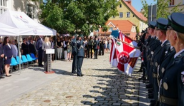
Wojewódzkie obchody dnia Krajowej Administracji Skarbowej