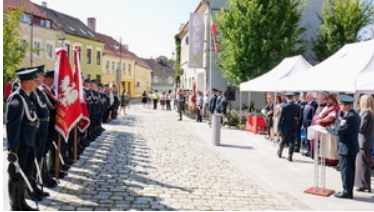
Wojewódzkie obchody dnia Krajowej Administracji Skarbowej