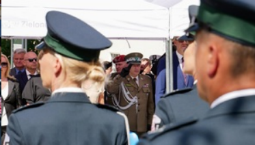
Wojewódzkie obchody dnia Krajowej Administracji Skarbowej