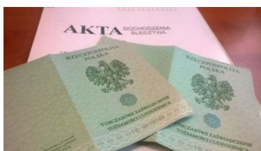
Wydawane cudzoziemcom dokumenty TZTC

Ponadto strona niemiecka przekazała funkcjonariuszom SG z placówki w Tuplicach, obywatela Rosji pochodzenia czeczeńskiego, który jak się okazało, może legalnie przebywać w Polsce, posiada polską kartę pobytu i korzysta z ochrony uzupełniającej w naszym kraju. Czeczen w rozmowie z funkcjonariuszami oświadczył, że powodem wyjazdu z Polski była chęć znalezienia pracy w Niemczech. Cudzoziemca pouczone o konieczności niezwłocznej aktualizacji posiadanych dokumentów.