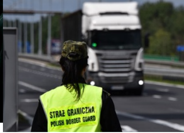
Kontrola drogowa samochodów ciężarowych