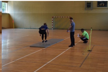
II etap postępowania kwalifikacyjnego