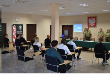
II etap postępowania kwalifikacyjnego