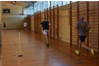
II etap postępowania kwalifikacyjnego