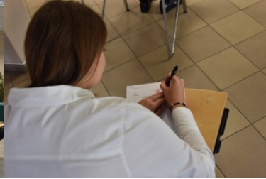
II etap postępowania kwalifikacyjnego