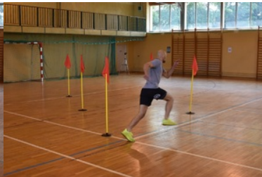
II etap postępowania kwalifikacyjnego