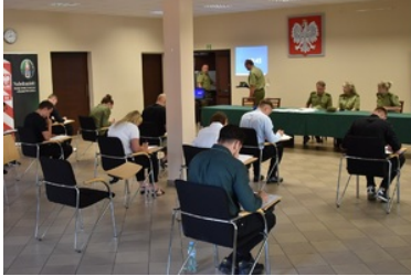
II etap postępowania kwalifikacyjnego