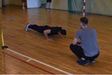
II etap postępowania kwalifikacyjnego