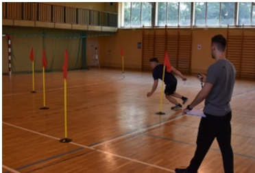
II etap postępowania kwalifikacyjnego