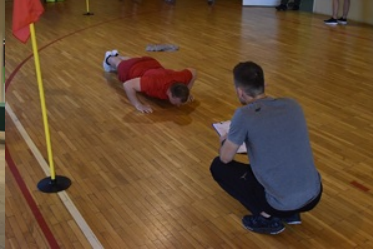
II etap postępowania kwalifikacyjnego