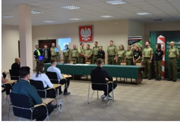
II etap postępowania kwalifikacyjnego