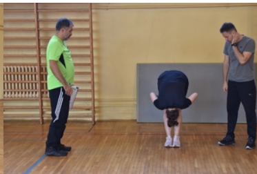
II etap postępowania kwalifikacyjnego