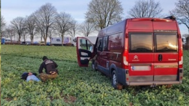
16 maja - Święto Straży Granicznej