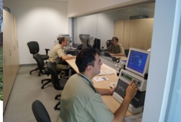
16 maja - Święto Straży Granicznej