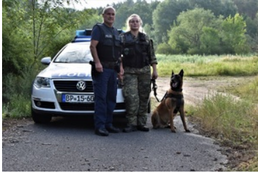
16 maja - Święto Straży Granicznej