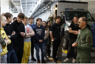
Promowanie służby w Straży Granicznej wśród młodzieży