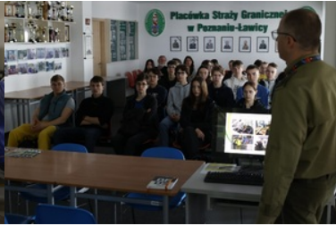
Promowanie służby w Straży Granicznej wśród młodzieży