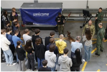
Promowanie służby w Straży Granicznej wśród młodzieży