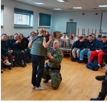
Promowanie służby w Straży Granicznej wśród młodzieży