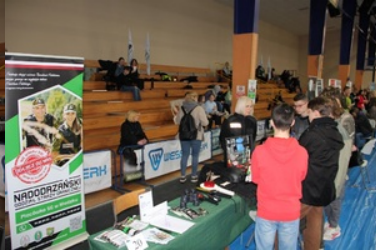
Promowanie służby w Straży Granicznej wśród młodzieży