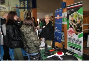
Promowanie służby w Straży Granicznej wśród młodzieży