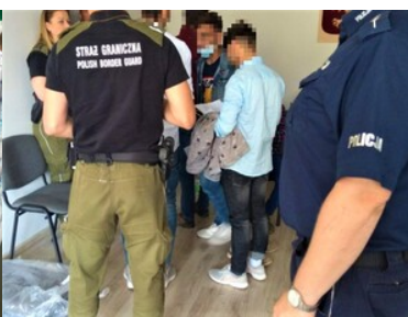
Pracowity poniedziałek w NoOSG