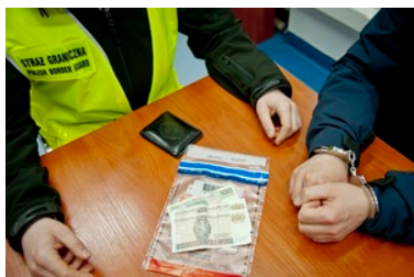
Pracowity poniedziałek w NoOSG

Natomiast kierowcy obu pojazdów usłyszeli już zarzuty pomocnictwa w przekroczeniu przez grupę cudzoziemców granicy państwowej wbrew przepisom. Obywatel Białorusi przyznał się do zarzucanego mu czynu i dobrowolnie poddał się karze w postaci 1 roku pozbawienia wolności z jednoczesnym warunkowym zawieszeniem wykonania kary na okres próby wynoszący 2 lata oraz przepadkiem korzyści majątkowej osiągniętej z przestępstwa w kwocie 500 zł. Wobec zatrzymanego Polaka w chwili obecnej trwają dalsze czynności.