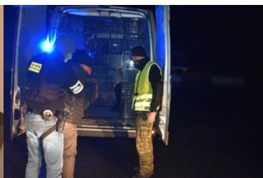
Pracowity poniedziałek w NoOSG