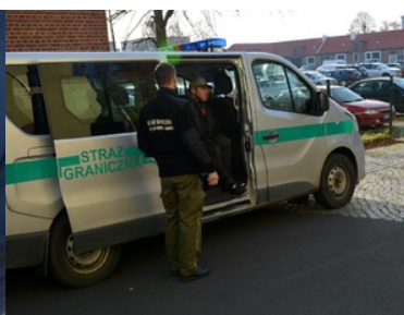
Pracowity poniedziałek w NoOSG