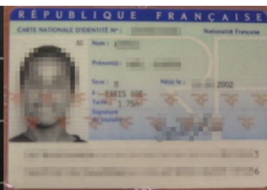
57 cudzoziemców posłużyło się podczas kontroli podrobionymi dokumentami