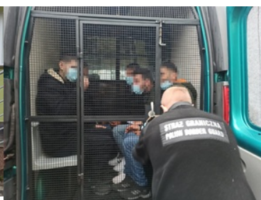
Cudzoziemcy zatrzymani za usiłowanie pgwp do Niemiec

W 2022 roku funkcjonariusze z placówek Nadodrzańskiego Oddziału przeprowadzili 2 711 kontroli legalności pobytu cudzoziemców na terytorium Polski oraz 223 kontrole legalności zatrudnienia, podczas których skontrolowano pracę 1016 cudzoziemców pochodzących z państw trzecich.