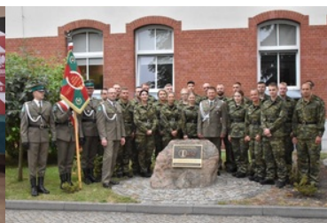
71 funkcjonariuszy złożyło ślubowanie