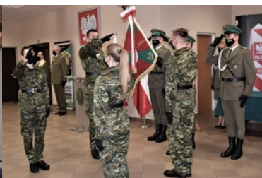
71 funkcjonariuszy złożyło ślubowanie