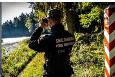
Funkcjonariusze NoOSG na wsparciu działań w ochronie granicy państwowej