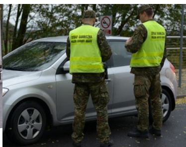
Kontrola Straży Granicznej