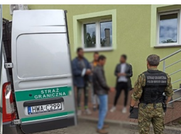
Cudzoziemcy zatrzymani za usiłowanie pgwp do Niemiec