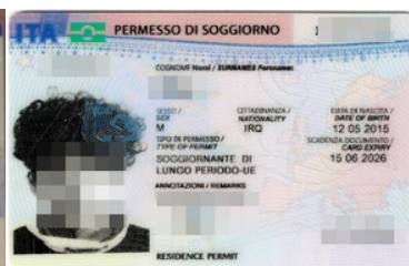
57 cudzoziemców posłużyło się podczas kontroli podrobionymi dokumentami