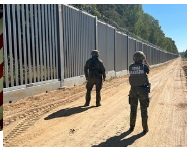
Funkcjonariusze NoOSG na wsparciu działań w ochronie granicy państwowej