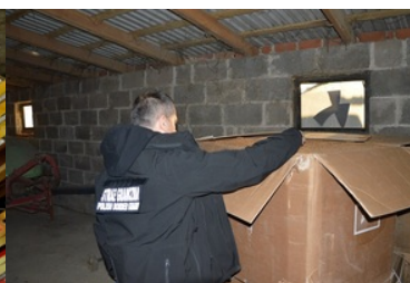
Zatrzymany tytoń pochodzący z nielegalnego źródła