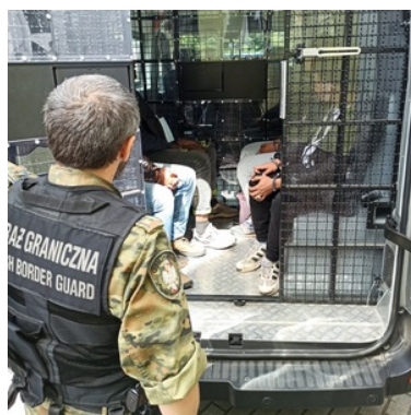
Cudzoziemcy zatrzymani za usiłowanie pgwp do Niemiec