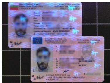
57 cudzoziemców posłużyło się podczas kontroli podrobionymi dokumentami

Dodatkowo funkcjonariusze Nadodrzańskiego Oddziału Straży Granicznej zatrzymali 397 osób, które poszukiwane były przez wymiar sprawiedliwości lub organy ścigania. Zatrzymano także 57 cudzoziemców, którzy podczas kontroli okazali funkcjonariuszom podrobione dokumenty.