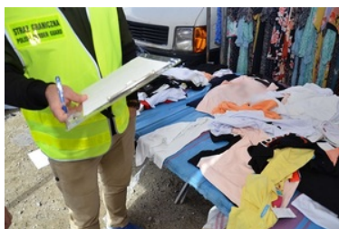
Zatrzymane podróbki markowych ubrań

W 2022 roku funkcjonariusze NoOSG zabezpieczyli nielegalny towar na kwotę blisko 40,5 miliona złotych. Były to między innymi narkotyki o wartości ponad 2,2 miliona złotych, wyroby tytoniowe warte blisko 33 miliony złotych, alkohol o wartości przeszło 330 tysięcy złotych, a także inne towary o wartości blisko 2,3 miliona złotych.