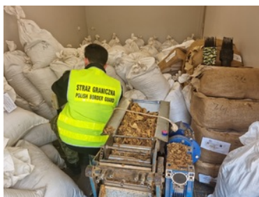
Zatrzymany tytoń pochodzący z nielegalnego źródła