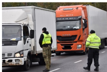
Kontrola Straży Granicznej

W związku z sytuacją migracyjną funkcjonariusze Nadodrzańskiego Oddziału Straży Granicznej zatrzymali w 2022 roku najwięcej osób, którym przedstawiono zarzut organizowania nielegalnego przekraczania granicy państwowej oraz pomocnictwa w popełnianiu tego przestępstwa. Łącznie funkcjonariusze SG zatrzymali 135 takich osób. Wśród nich było 56 obywateli Ukrainy, 16 obywateli Gruzji, 9 obywateli Białorusi, 9 Polaków oraz obywatele Tadżykistanu, Iraku, Azerbejdżanu, Armenii, Egiptu, Rosji i Niemiec.