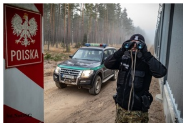
Funkcjonariusze NoOSG na wsparciu działań w ochronie granicy państwowej

Rok 2022 był rokiem intensywnych kontroli mających na celu zapobieganie i przeciwdziałanie nielegalnej migracji szczególnie cudzoziemców dostających się nielegalnie z Białorusi oraz tych z tzw. Szlaku Bałkańskiego”. Duży wpływ na realizację zadań miały nałożone na oddział dodatkowe obowiązki, związane przede wszystkim z funkcjonującymi od poprzedniego roku dodatkowymi pomieszczeniami Strzeżonego Ośrodka dla Cudzoziemców w Wędrzynie, a także oddelegowania funkcjonariuszy naszego Oddziału do działań realizowanych na wschodzie kraju.