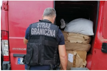
Zatrzymany tytoń pochodzący z nielegalnego źródła