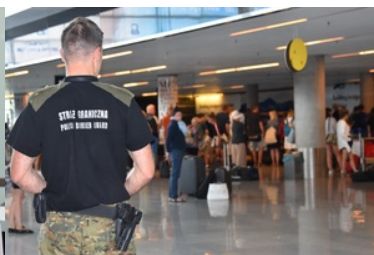
Kontrola dokumentów na lotnisku