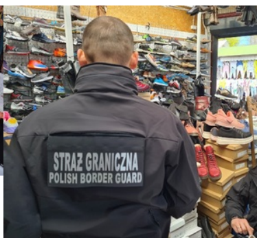
Zatrzymane podróbki markowych ubrań