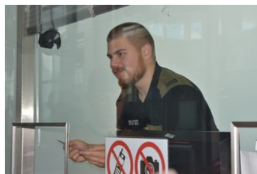
Kontrola dokumentów na lotnisku

Funkcjonariusze SG odprawili ponad 5 milionów podróżnych w ruchu Schengen i NON Schengen.