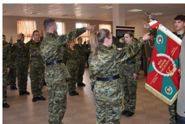
71 funkcjonariuszy złożyło ślubowanie

Przez cały 2022 rok w Nadodrzańskim Oddziale SG prowadzony był nabór do służby. W tym okresie 449 kandydatów złożyło wymagane dokumenty i przystąpiło do rekrutacji. W ubiegłym roku 71 osób zostało przyjętych do służby w Nadodrzańskim Oddziale Straży Granicznej.