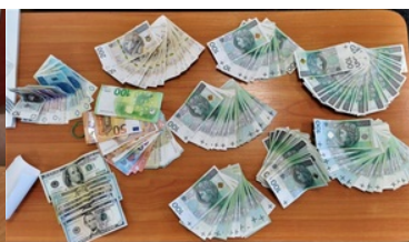
Zabezpieczona gotówka pochodząca z przestępstwa