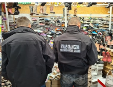
Zatrzymane podróbki markowych ubrań