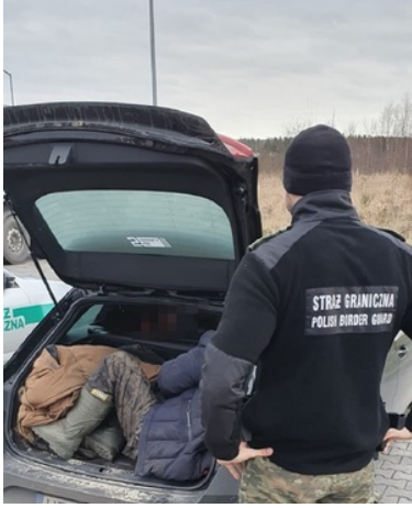
Zatrzymani obywatele Jemenu