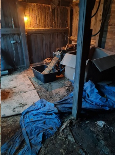
Nielegalne papierosy mogą być wywarzane nie tylko z tytoniu