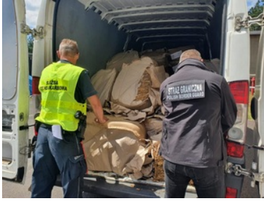
Zatrzymany nielegalny towar akcyzowy