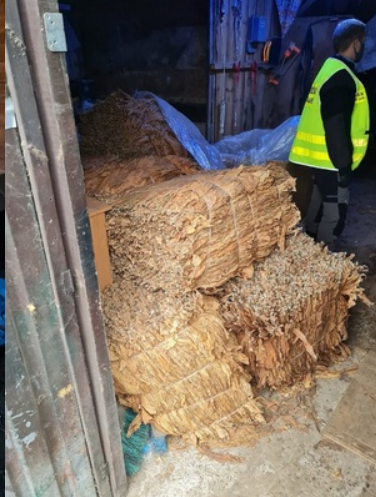
Członkowie grupy wprowadzili do obrotu towar wart kilkadziesiąt milionów złotych