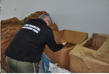
Towar przechowywany jest w różnych warunkach