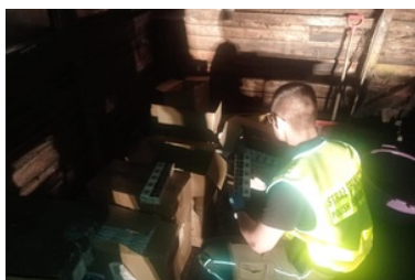
Nielegalny towar zatrzymany pod Jarocinem

Za popełnienie przestępstwo karno-skarbowego 65-latkowi grozi wysoka kara grzywny, a także kara pozbawienia wolności.