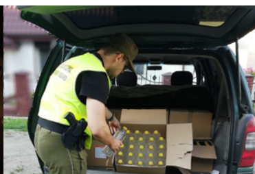
W kontrolowanym aucie funkcjonariusze SG ujawnili nielegalny alkohol