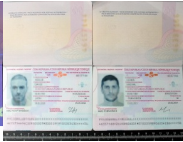
Podrobiona strona personalizacyjna w świetle dziennym