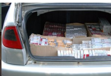
PSG w Zgorzelcu