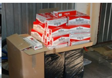
PSG w Zgorzelcu

Nielegalne papierosy ujawnili w tym samym dniu także funkcjonariusze z Placówki SG w Zielonej Górze – Babimoście. Około godziny 22-iej w centrum Zielonej Góry strażnicy graniczni wytypowali do kontroli samochód osobowy marki Mazda z niemieckimi numerami rejestracyjnymi. Kierujący mazdą nie zatrzymał się do kontroli i zaczął uciekać, lecz kiedy funkcjonariusze podjęli pościg kierowca zaniechał ucieczki i zatrzymał pojazd po kilkuset metrach.